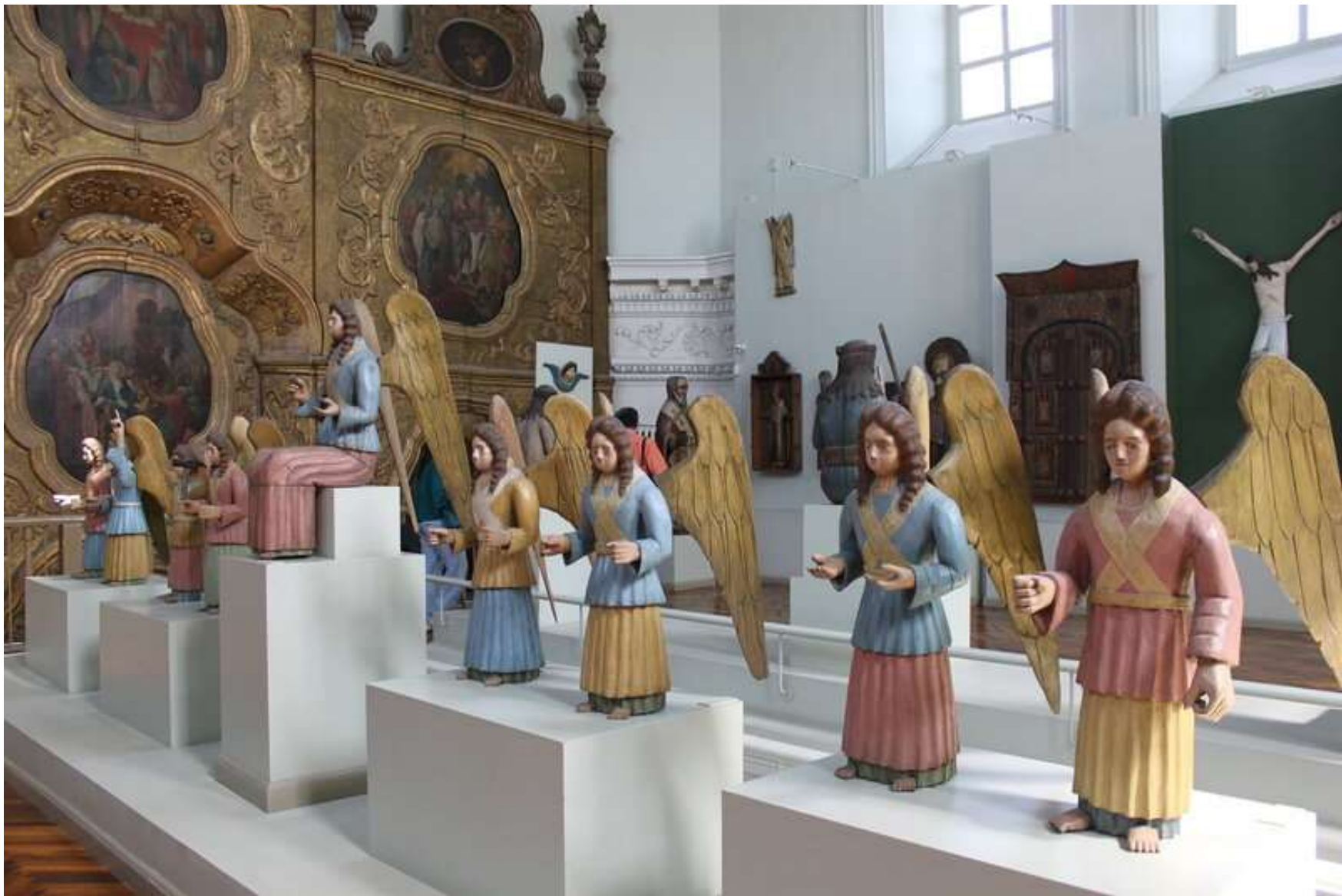
Выставка «Пермские боги»